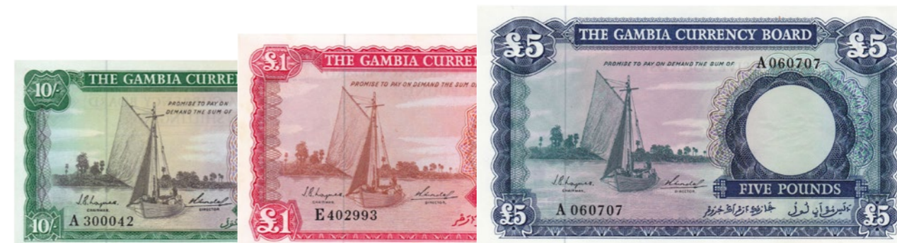
Afgebeelde bankbiljetten maken deel uit van lot 1235