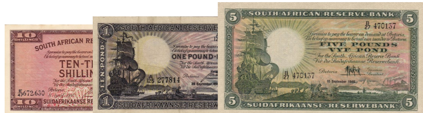
Afgebeelde bankbiljetten maken deel uit van lot 1287