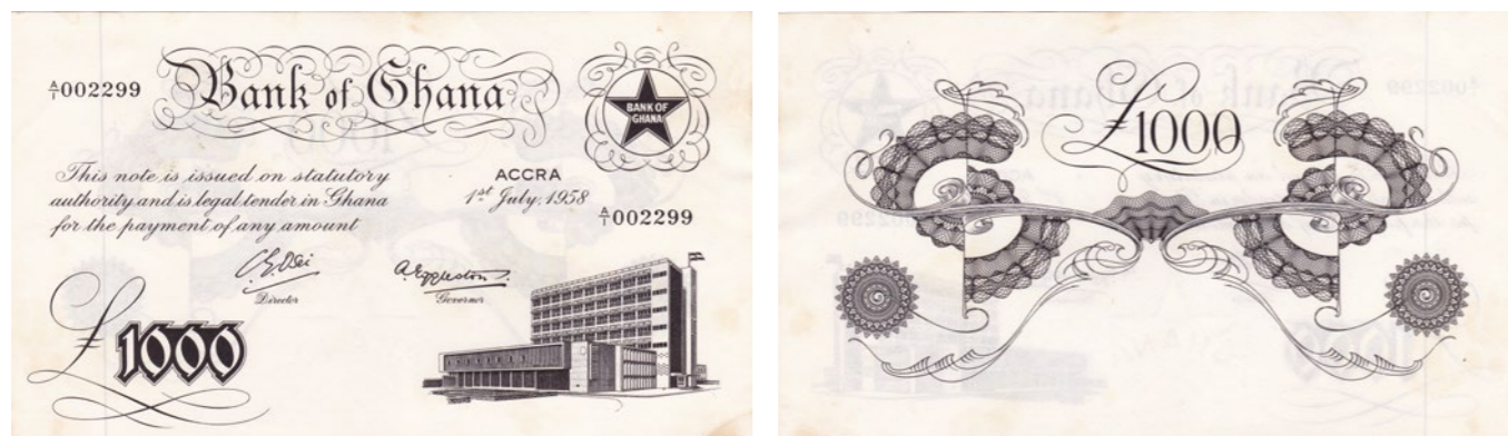
Afgebeelde bankbiljetten maken deel uit van lot 1236