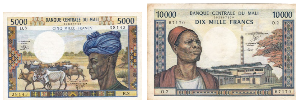
Afgebeelde bankbiljetten maken deel uit van lot 1263