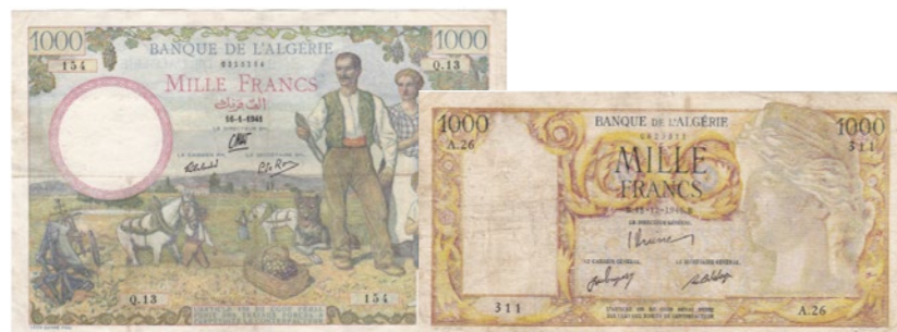
Afgebeelde bankbiljetten maken deel uit van lot 1200