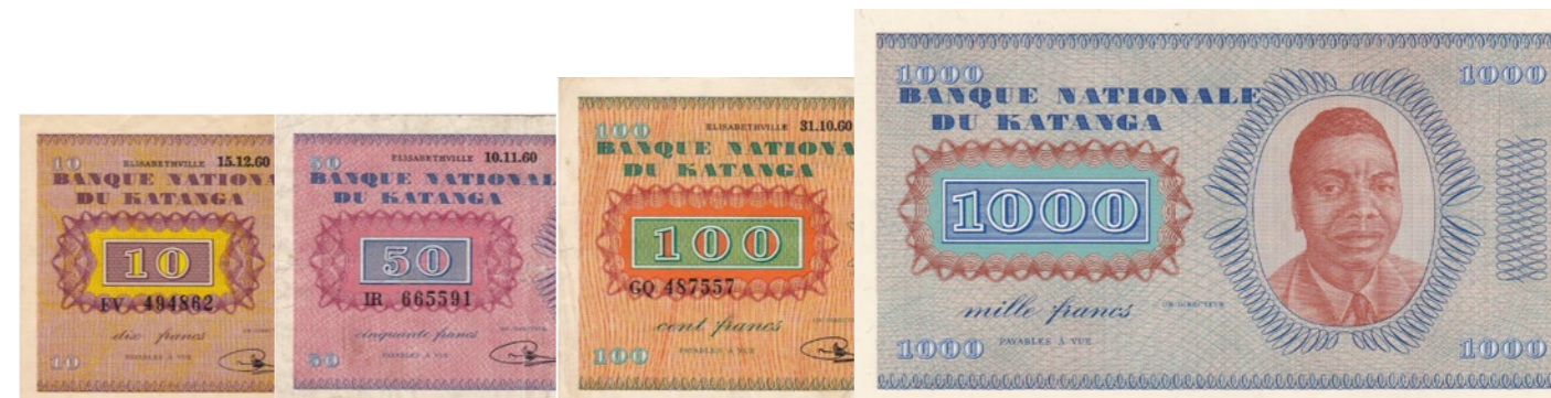
Afgebeelde bankbiljetten maken deel uit van lot 1251