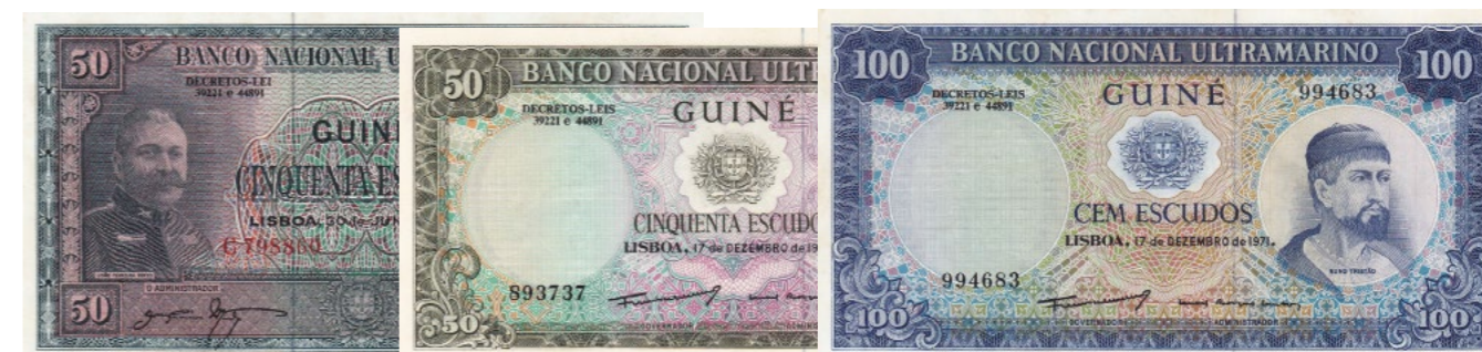
Afgebeelde bankbiljetten maken deel uit van lot 1273