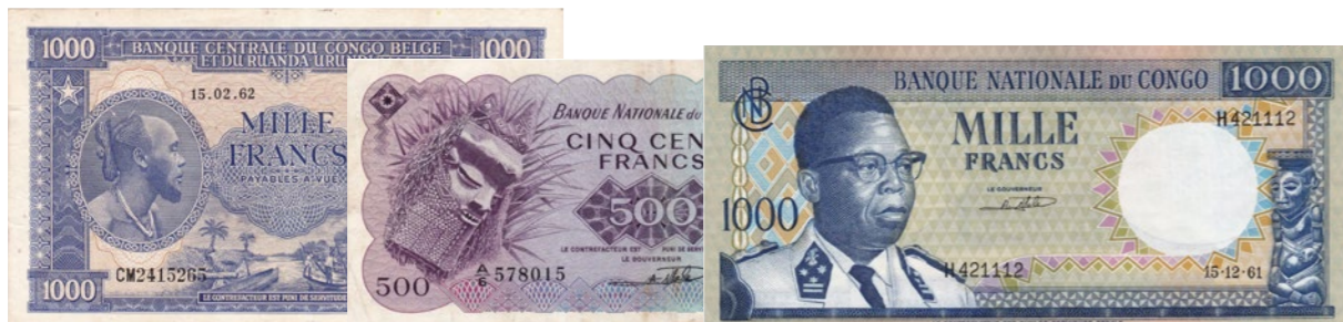
Afgebeelde bankbiljetten maken deel uit van lot 1219