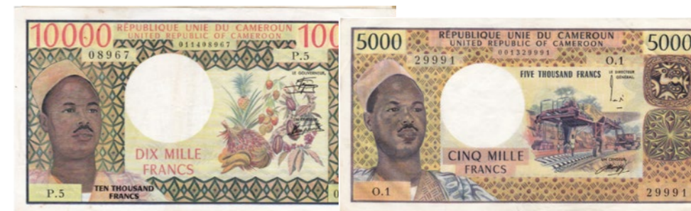
Afgebeelde bankbiljetten maken deel uit van lot 1209