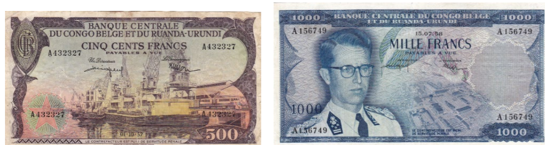
Afgebeelde bankbiljetten maken deel uit van lot 1203