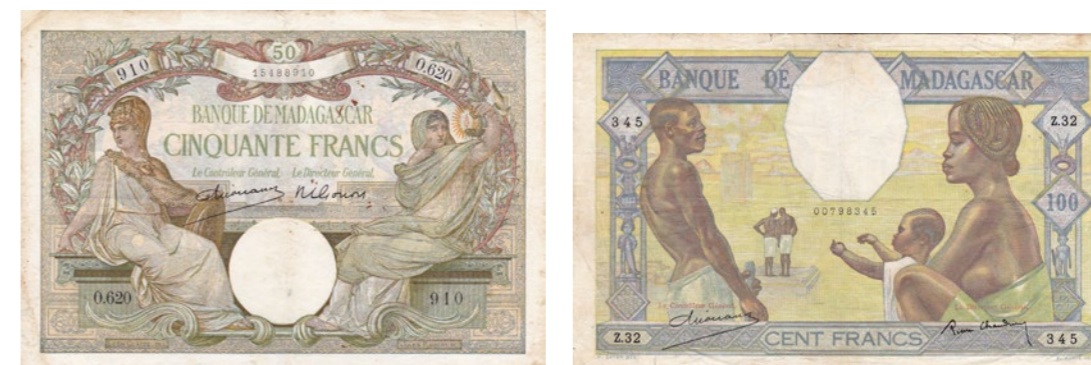
Afgebeelde bankbiljetten maken deel uit van lot 1258