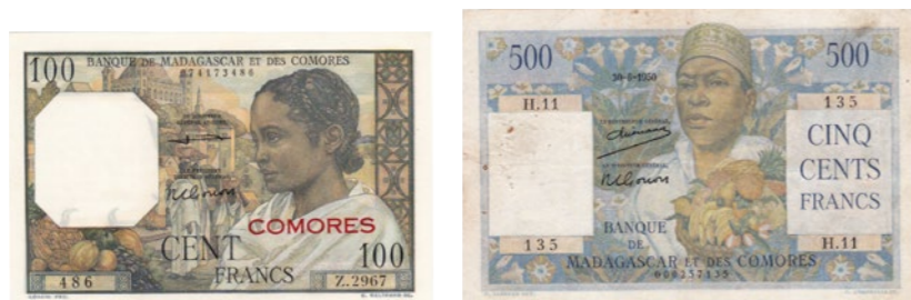
Afgebeelde bankbiljetten maken deel uit van lot 1218