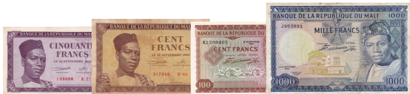
Afgebeelde bankbiljetten maken deel uit van lot 1262