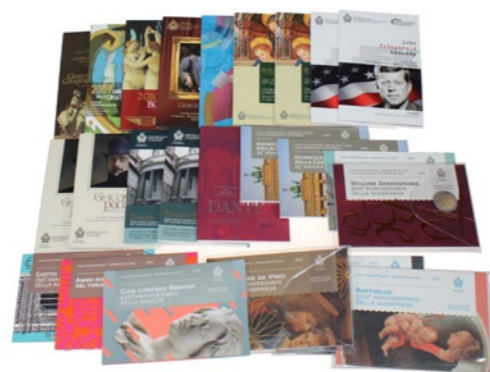
766 Verkleind afgebeeld