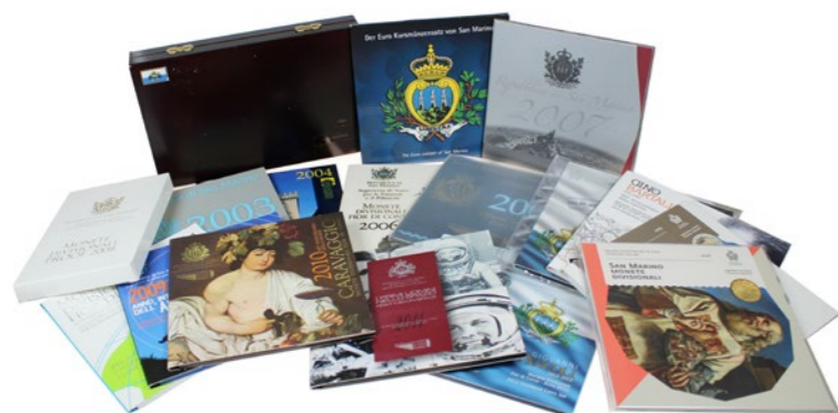
762 Verkleind afgebeeld