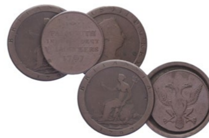
654 Verkleind afgebeeld