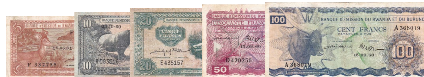
Afgebeelde bankbiljetten maken deel uit van lot 1277