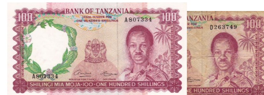
Afgebeelde bankbiljetten maken deel uit van lot 1296