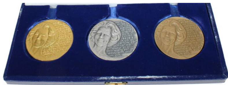
3639 Verkleind afgebeeld